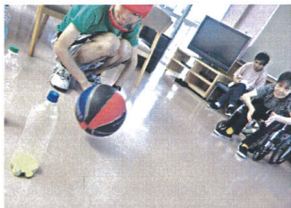
『慎重に狙って、狙って…』