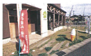
『素敵な外観…建物の 雰囲気って大切！』