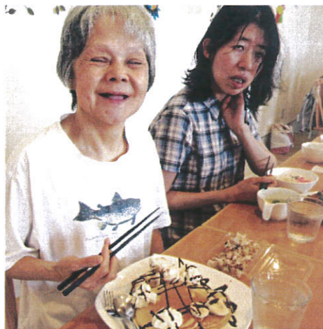
『おいしそうなランチを前に 自然と笑顔』

今回は江南区の「メイプルかめだ」でワンコインランチを楽しみました。ワンコインとはいえ、ボリューム満点！サラダやスープ、デザートもついて栄養、味、価格、お店の雰囲気も（やっぱり！）大満足の外食ツアーとなりました。