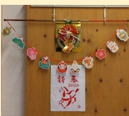
お正月飾りin陽だまり