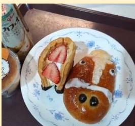
令和8年の干支 『うまパン』 たっぷりチョコ で「ウマイ！」